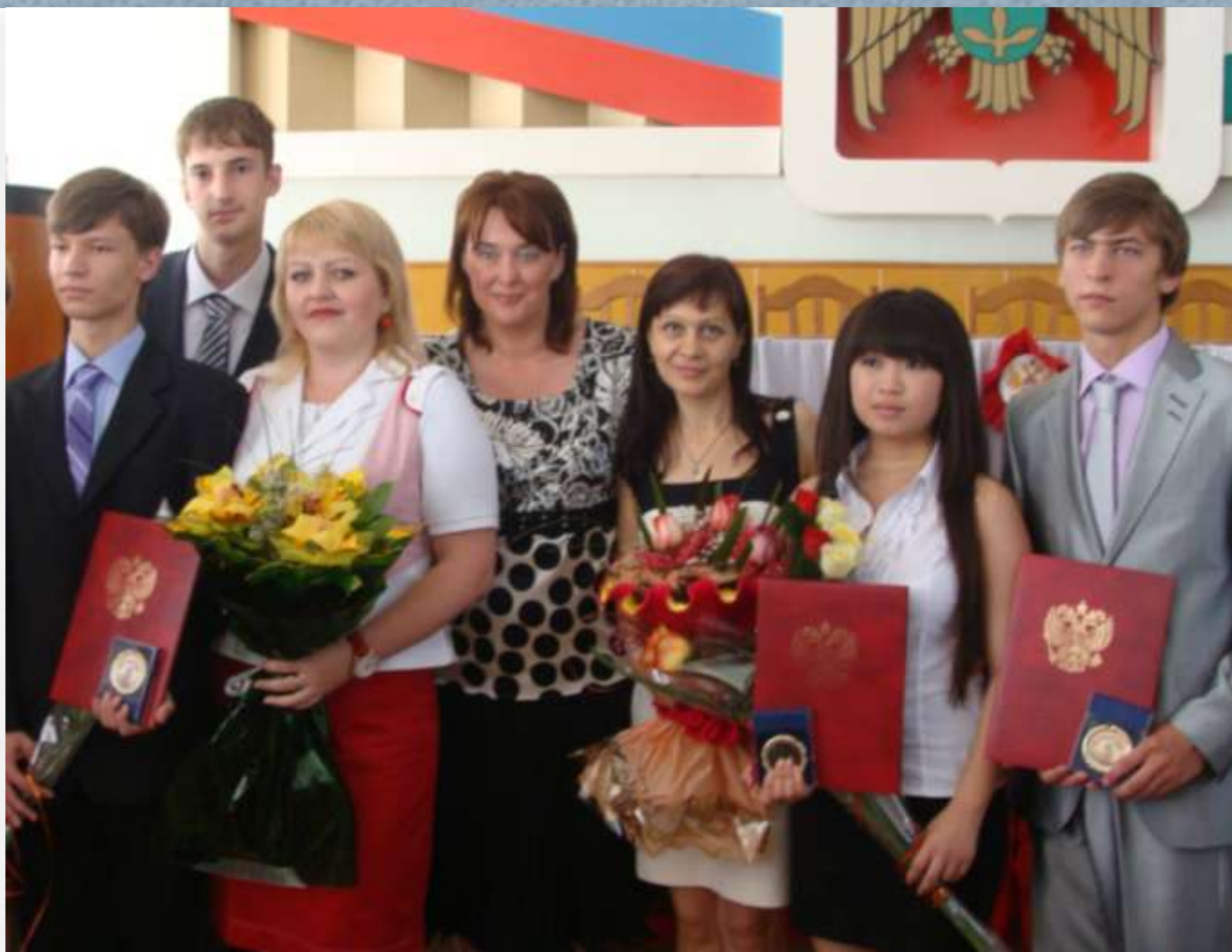
Лауреат премии Главы местной администрации г.о. Прохладный, КБР 2010г